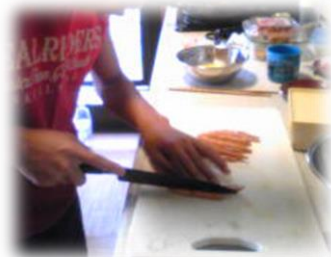
いっしょにお料理