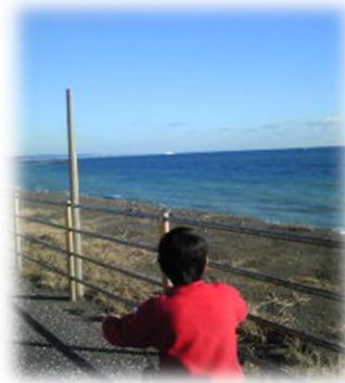
次の日、サイクリング

一つでもチェックしたあなたは、お気軽に「早稲田大学里親研究会」にお越しください！