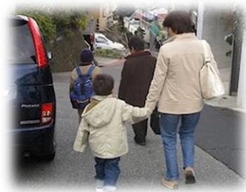
児童養護施設にお迎え